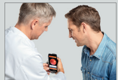
Spiegazione dei risultati ai pazienti